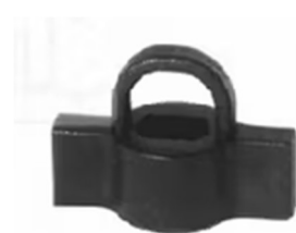
mixer voor verwarmen chocomelk